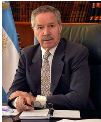
Felipe Solá 2002-2003 Partido Justicialista