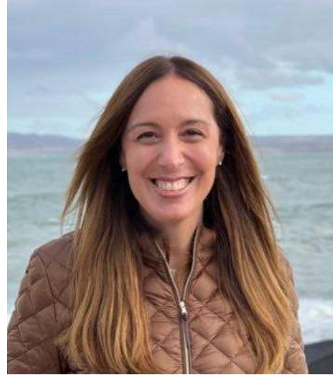
María Eugenia Vidal 2015-2019 Cambiamos