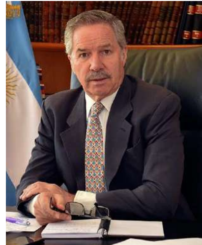
Felipe Solá 2003-2007 Frente para la Victoria