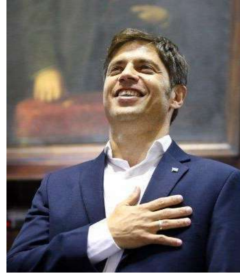
Axel Kicillof 2019-2023 Frente de Todos