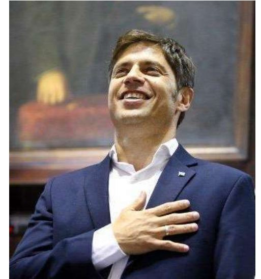
Axel Kicillof 2023-2027 Unión por la Patria