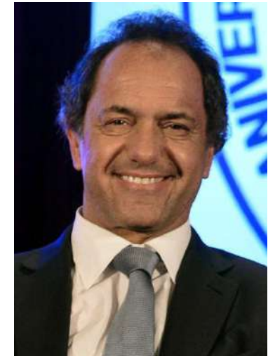
Daniel Scioli 2007-2011 Frente para la victoria