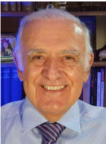
Carlos Ruckauf 1999-2002 Partido Justicialista