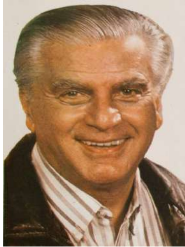
Antonio Cafiero 1987-1991 Partido Justicialista