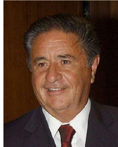
Eduardo Duhalde 1991-1995 Partido Justicialista