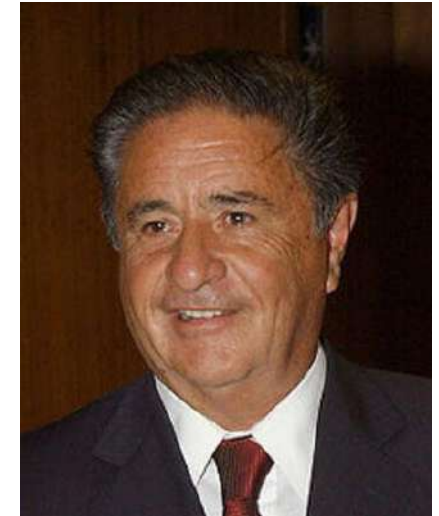
Eduardo Duhalde 1995-1999 Partido Justicialista