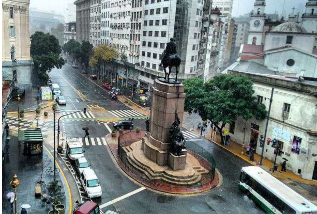
Monumento a Julio Argentino Roca

“Llegando” por Diagonal Sur a conquistar a Buenos Aires