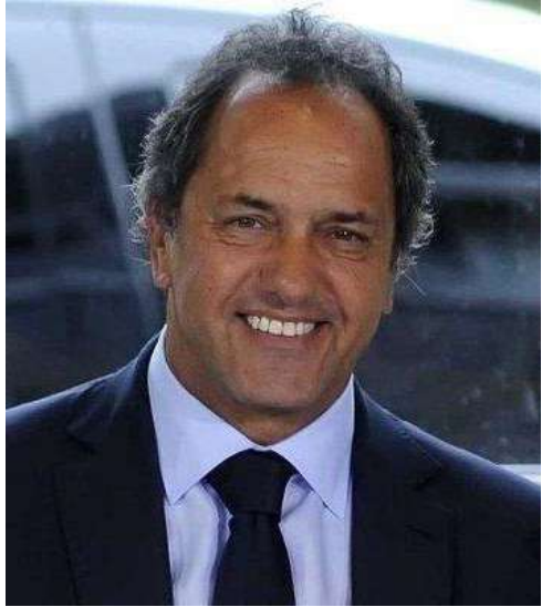
Daniel Scioli 2011-2015 Frente para la victoria